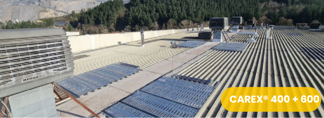
CAREX® 400 + 600